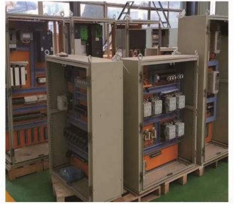
控制箱 Control Box