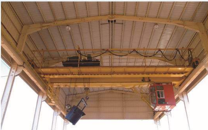
铸造吊 QDY Foundry Overhead Crane