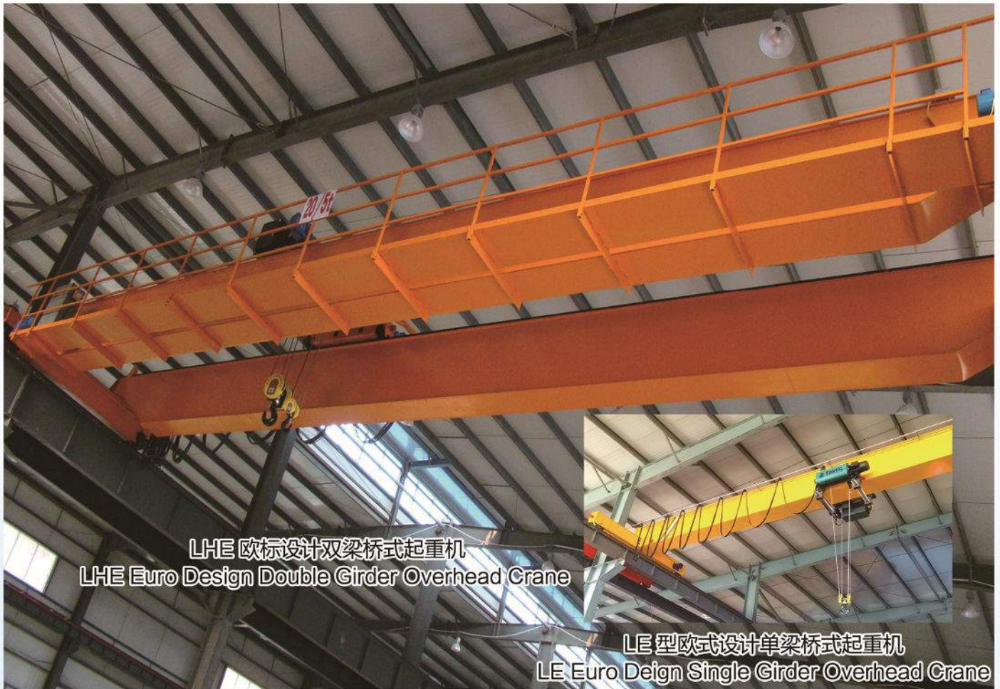
LHE 欧标设计双梁桥式起重机 LHE Euro Design Double Girder Overhead Crane