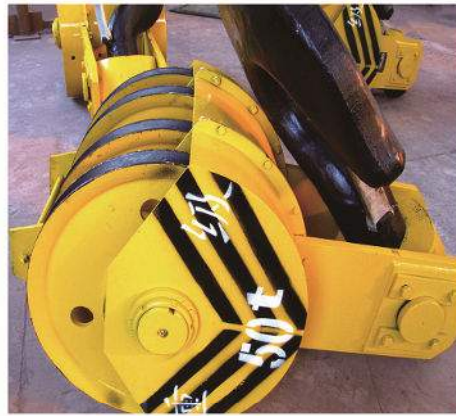
吊钩组 Hook Block