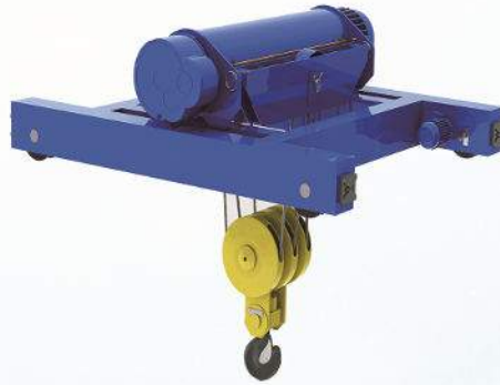
双梁葫芦小车 Hoist Trolley