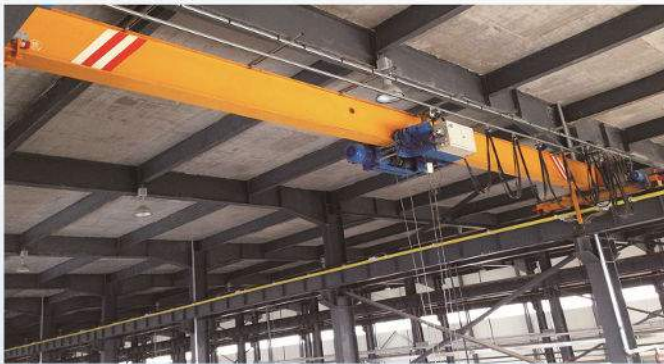
低净空单梁桥式起重机 Low Room Type Single Girder Overhead Crane