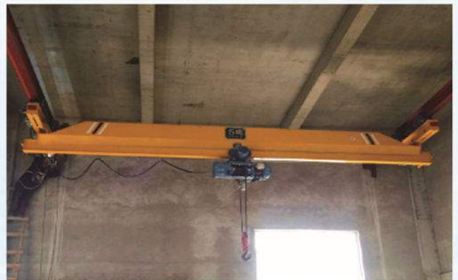
LX型悬挂单梁桥式起重机 LX Underhung Single Girder Bridge Crane