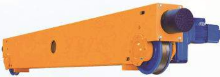
起重机端梁 Crane End Truck