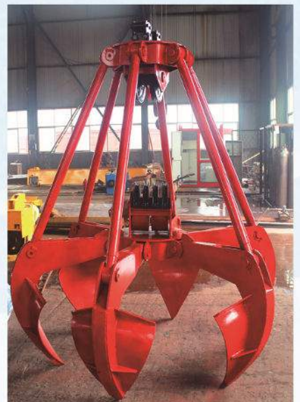
抓斗 Crane Grab