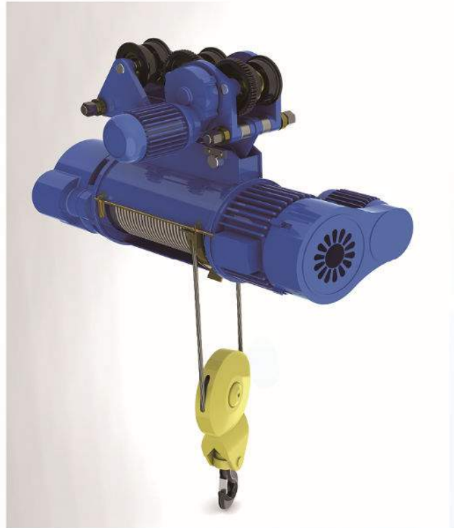
普通CD/MD钢丝绳电动葫芦 Universal CD/MD Wire Rope Electric Hoist