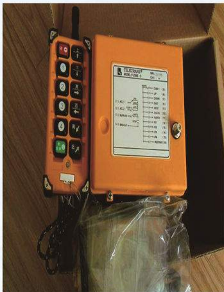
遥控器 Remote Control System