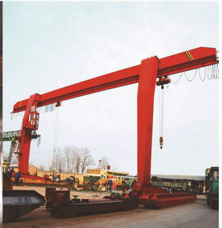
L型货场用单梁门式起重机 L type Single Girder Gantry Crane