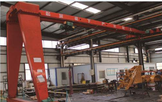
MB型半龙门式起重机 MB Semi Girder Gantry Crane