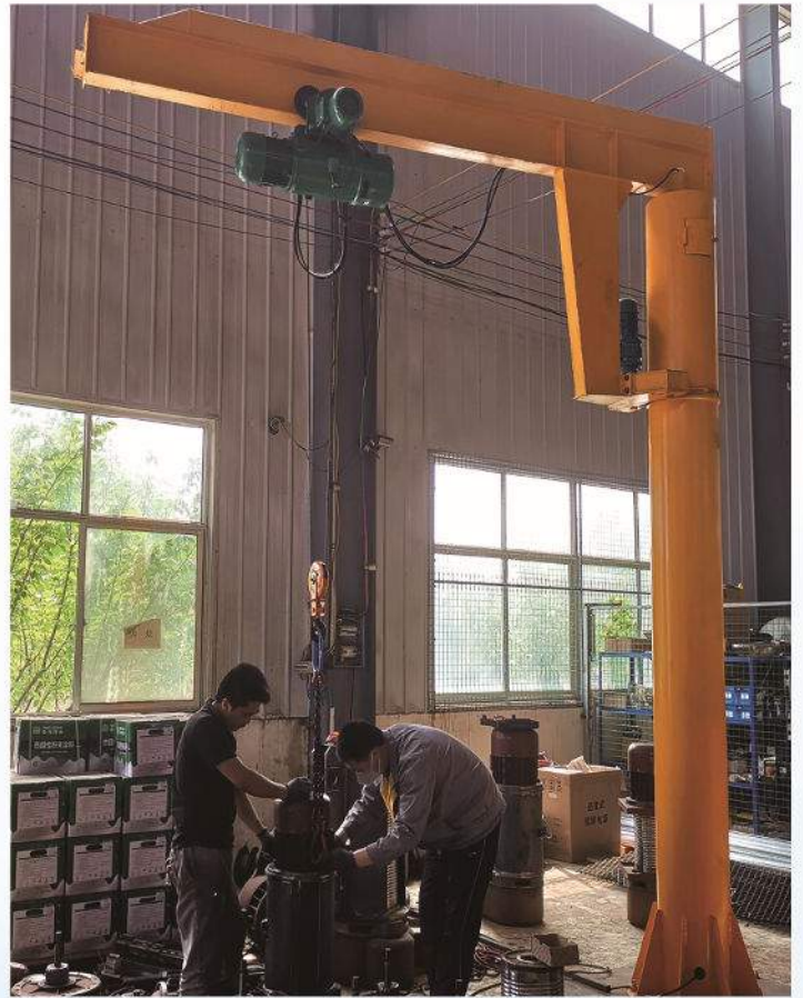
BZ型普通定柱式悬臂式起重机 BZ Model Column Type Jib Crane