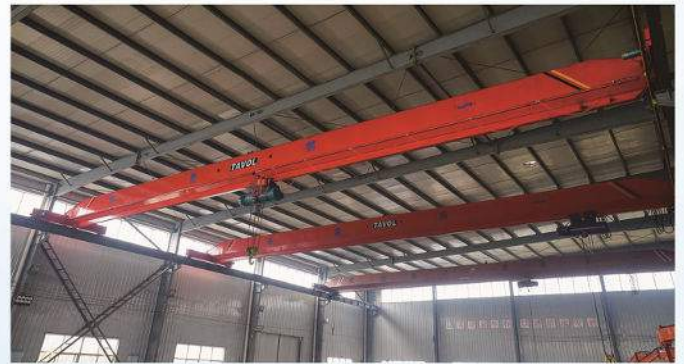
普通单梁桥式起重机 Universal type Single Girder Overhead Crane