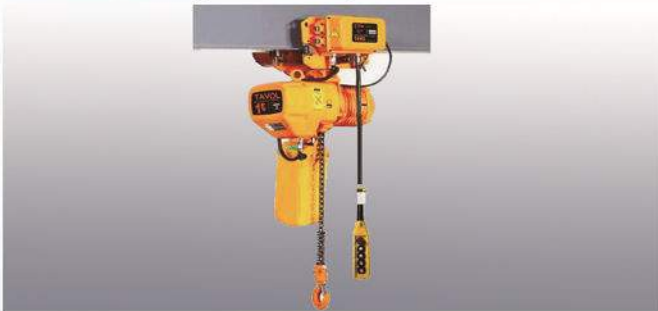
环链式电动葫芦 Electric Chain Hoist