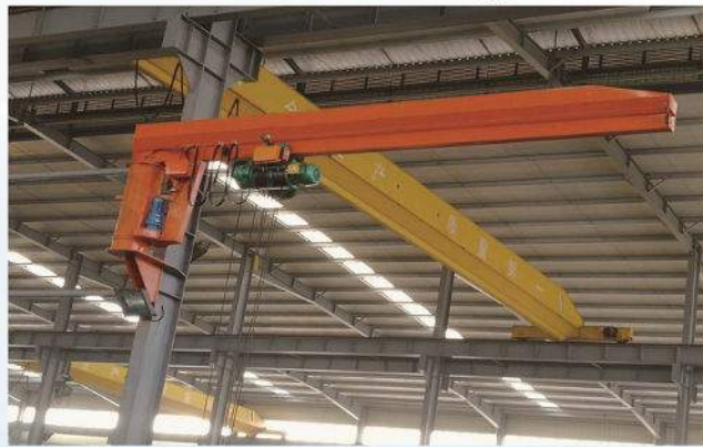
BX型墙壁式悬臂吊 BX Model Wall Mounted Jib Crane