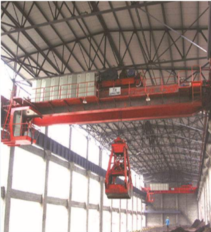
QZ 型抓斗双梁桥式起重机 QZ Grab type Double Girder Overhead Crane