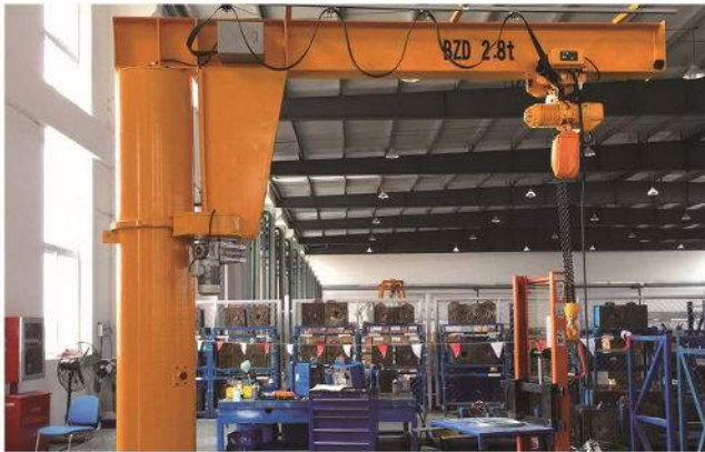
BZD欧标设计定柱式悬臂吊 BZD Euro Design Column Type Jib Crane