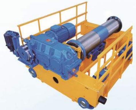
卷扬机小车 Winch Trolley