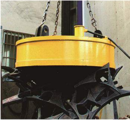
电磁铁 Lifting Magnet