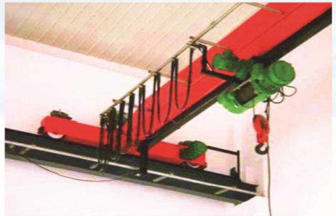
防爆单梁 LB Explosive-proof Overhead Crane